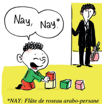
*NAY: Flûte de roseau arabo-persane